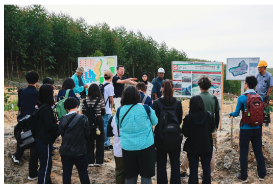
スマトラ島でのフィールドワーク